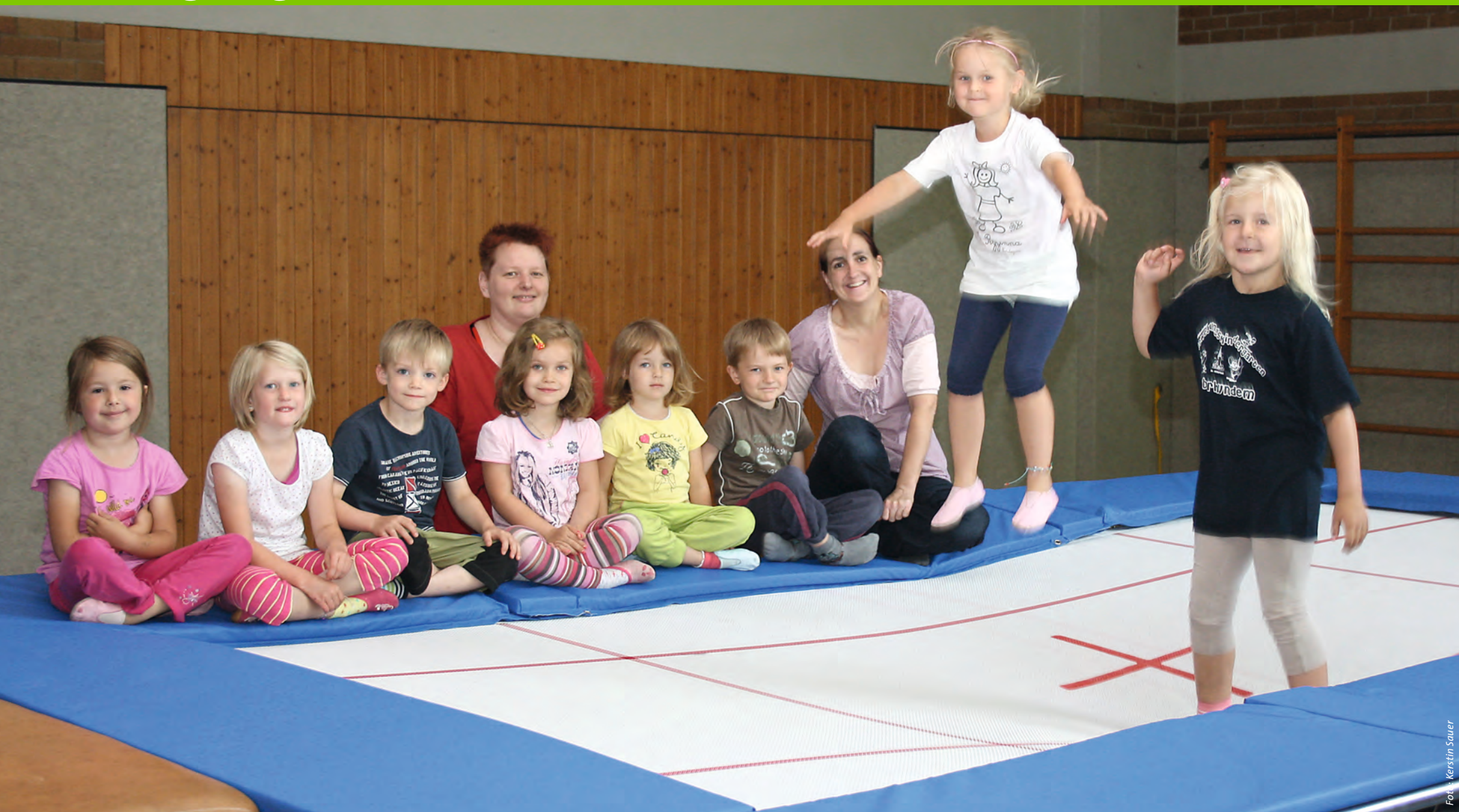
Wenn Kinder und Erzieherinnen auf das Großtrampolin dürfen, freuen sie sich um die Wette. Kein Wunder: Es ist nachgewiesen, dass beim Springen Glückshormone ausgeschüttet werden.