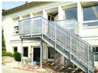
Links: Der neue Haupteingang in St. Aposteln